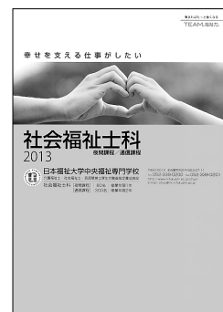
社会福祉士科パンフレット

出願要項配布中! [資料請求先: 日本福祉大学中央福祉専門学校] TEL 052(339)0200 http://www.n-fukushi.ac.jp/chuo/ * ホームページからも資料請求ができます。