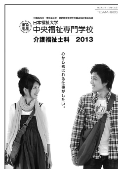
介護福祉士科パンフレット