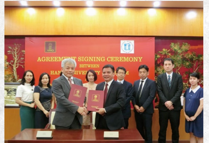
ハノイ大学での締結式