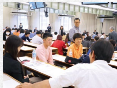
医療関係者、社会福祉法人関係者、自治体担当者、日本福祉大学学生・教職員など、参加者が23グループに分かれ、「私にとっての“減災と連携”を考える」をテーマに語り合いました。