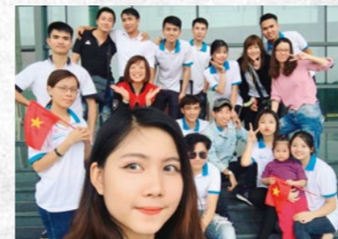
インターンシッププログラムの様子

日本福祉大学は、海外の大学との14校目となる大学間連携協定を、ベトナムを代表する国立の名門・ハノイ大学と締結しました。その締結式が2018年8月28日(火)、ハノイ大学ゲストホールにて行われました。大学間連携協定で特に強調されているのが、「日本語教師インターンシッププログラム」です。これは日本福祉大学国際福祉開発学部で日本語教師養成プログラムを履修する学生が、ハノイ大学日本語学部で約1カ月間のインターンシッププログラムを受けるもので、国際福祉開発学部日本語教師養成課程で学ぶ2年生13名が順次、留学しています。世界でも有数の日本語教育を展開する高度な教育機関を経験することで学生の成長を促すとともに、教員間交流、共同研究も同時に開始予定で、協定締結を機に連携を深めていきます。