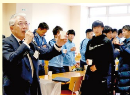
安川会長による乾杯のあいさつ。

表彰式後には、美浜キャンパスの生協食堂「食菜-tabena-」で懇親会が開かれ、軽食を楽しみながら受賞学生たちが交流しました。