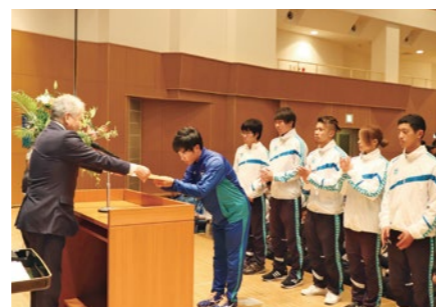
見玉学長から表彰状を授与。