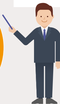
■分野別の主な選考(試験)開始時期 ※2018年度