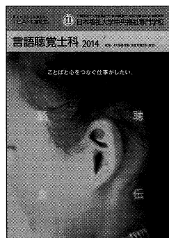
言語聴覚士科パンフレット