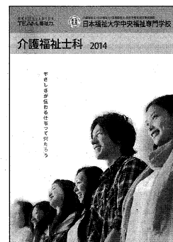
介護福祉士科パンフレット