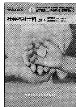
社会福祉士科パンフレット

学生募集要項配布中! [資料請求先: 日本福祉大学中央福祉専門学校] TEL 052(339)0200 http://www.n-fukushi.ac.jp/chuo/ *ホームページからも資料請求ができます。