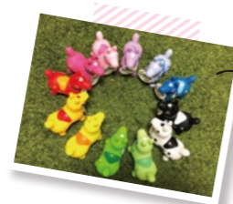
大好きなイタリア生まれの人形「ロディ」コレクション!