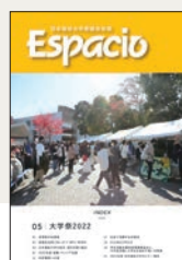
会報誌「エスパシオ」▶