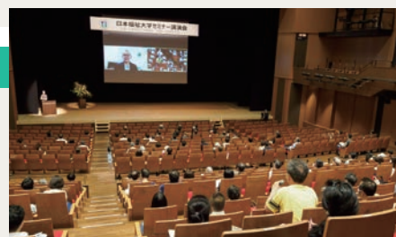
大学セミナー開催風景 ▶